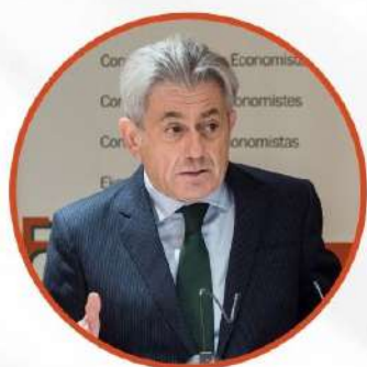
VALENTÍN PICH Presidente del Consejo General de Economistas